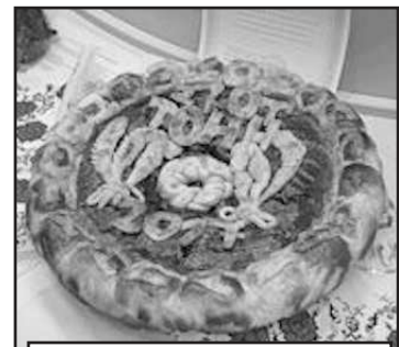
Каравай от В.В. Хорвата.